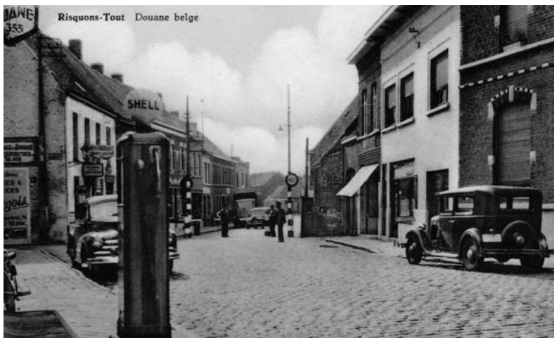
Ancienne carte postale de la douane du Risquons-Tout à Mouscron.

l'extrême frontière de Belgique, que s'élançant d'ordinaire les fraudeurs à pied et à cheval dont le dernier mot, à leur départ, est celui-ci "Risquons-Tout" ! ».