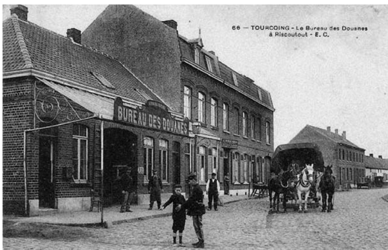
Ancienne carte postale du Bureau des Douanes Riscontout à Tourcoing

ont communiqué le nom de leur enseigne à des quartiers ou à des endroits.