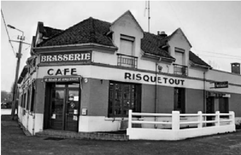
Photo anonyme du café Risquetout à Doullens