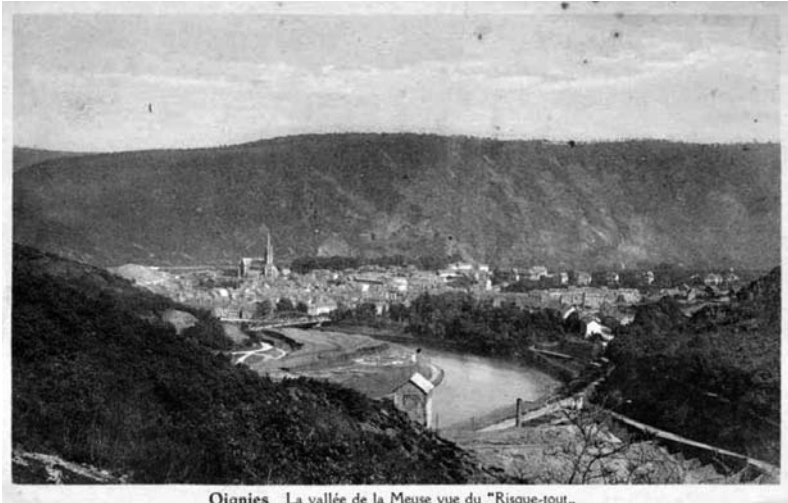
Oignies La vallée de la Meuse vue du "Risque-tout."

La vallée de la Meuse française vue du Risque-Tout à Oignies.