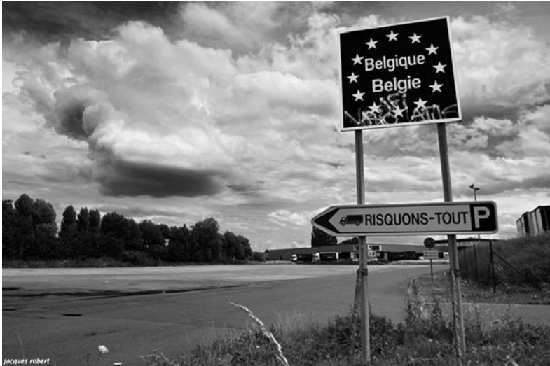
L'ancien poste-frontière proche du Risquons-Tout à Mouscron.

Le hameau puis le quartier du Risquons-Tout à Mouscron [To 7] domine une série d'autres Risquons-Tout et Risque-Tout en Belgique qu'on ne peut pas dissocier.